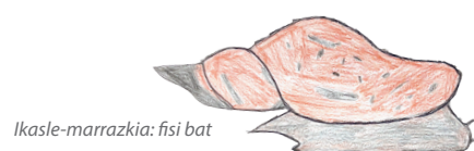
Ikasle-marraskia: fisi bat

Datorren urte hastapenetik aitzina, ikasleek leku moderno, argitsua eta erabilgarria erabiltzen ahalko dute, beren eguneroko erosotasunerako eta ongizaterako pentsatua izan dena. Herriko Etxeak Arbonako haur guzietan kalitatezko bizi eta ikasketa ingurumena eskaintzeko duen nahiaren ildotik doa jantegi berria.